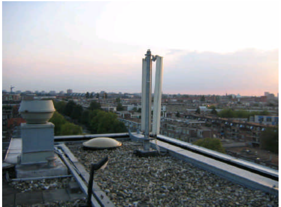
Typische GSM zendinstallatie zoals die bovenop veel gebouwen te vinden is

voor de FM zenders in de grotere zendmasten. FM frequenties zijn 80 tot 108 MHz. Het vermogen van AM zenders is hoger en kan oplopen tot bijvoorbeeld 600.000 Watt op frequenties van 153 kHz tot 1602 kHz (1,6 MHz). De zenders worden meestal op grote hoogte geplaatst waardoor het grootste deel van het vermogen over de nabijgelegen huizen heen straalt. Daarnaast is de straling ongepulst, waardoor er minder snel biologische effecten optreden. Toch is het niet aan te raden om binnen enkele kilometers van een grote radio/tv zendmast te wonen. Elektrische apparatuur wordt regelmatig gestoord en gezondheidseffecten zijn verre van uit te sluiten.