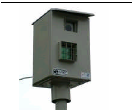
Flitspalen maken gebruik van radar

De ronde trommels die vaak te vinden zijn in zendmasten met GSM/UMTS basisstations verzorgen directe straalverbindingen waarover alle gesprekken verzonden worden naar