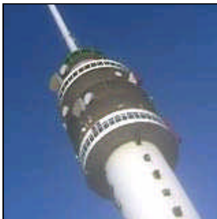
Zendmast radio en televisie

Zenders voor analoge radiouitzendingen zijn een van de eerste toepassingen van hoogfrequente elektromagnetische straling. Deze zenders bestaan al sinds het begin van de 20e eeuw. Huidige radiozenders zoals bijvoorbeeld in de zendmast van Lopik gebruiken analoge en ongepulste modulatie (AM/FM). Het vermogen per zender ligt rond de 100.000 Watt