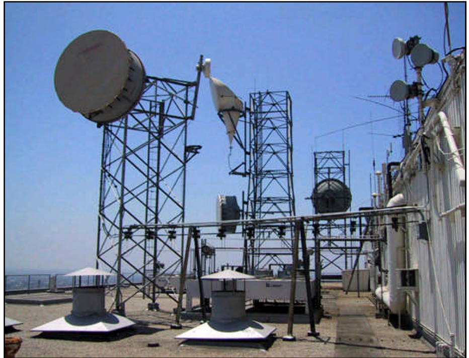
Verschillende microwaves die zorgen voor straalverbindingen

een plek waar de verbinding met het vaste telefoonnet gemaakt wordt. De straling wordt in een zeer compacte bundel verzonden. Hierdoor is de in de praktijk de overlast van dit soort zenders relatief klein, tenzij ze verkeerd afgesteld zijn uiteraard. KPN gebruikt straalverbindingen het minst omdat KPN nagenoeg overal aansluitingen heeft voor het vaste net. Vooral de andere providers gebruiken deze microwaves.