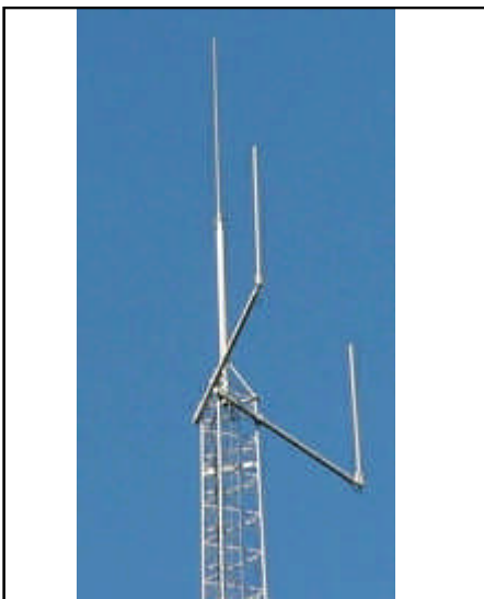
Typisch C2000 basisstation

Bakkies werken op 27 MHz, vandaar de naam 27MC, maar ook andere frequenties zijn mogelijk. De modulatie is analoog en is vergelijkbaar met die van radiozenders. Het vermogen is officieel 0,5 Watt, maar (illegale) versterkers kunnen dat opvoeren tot zo'n 150-200 Watt.